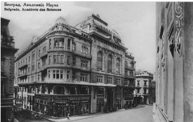
Слика 4 Палата Српске краљевске академије око 1925. године, разгледница, издање Љ. Палер; Музеј града Београда (Ур. 15275)

одлике различитих европских модернитета – бечке сецесије и стилске атмосфере Fin de siècle се једне и париског Art Nouveau и духа Belle Époque са друге стране, развијао се у својим варијантама у периоду од 1890. до 1914. године. У тренутку кад је прихваћен за реализацију оваква синтеза се могла сматрати савременом. Ипак, одлагањем изградње, и окаснелом реализацијом, оваква концепција је 1924 године кад је објекат завршен, била у уметничком погледу ускоро превазиђена продором нових градитељских тенденција које ће резултирати рецепцијом стила Ар деко средином треће деценије. 49 У односу на академизам који је током треће деценије и даље суверено доминирао српском јавном архитектуром, надовезујући се на централно европска и руска идејна решења, палата САНУ представљала је значајан искорак. Промена градитељског концепта била је одраз трагања за савременим приступом које је отворило период стилских недоумица у српској архитектури треће деценије. Декоративност и модерност као и потреба за удаљавањем од доминантне историцистичке матрице, наговештени палатом САНУ, отвориће ново поглавље српског градитељства у коме ће се до Другог светског рата под окриљем модерних архитектонских токова потеклих из Париза.