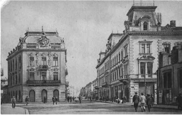
Слика 3 Кнез Михаилова улица око 1920. године, разгледница, издање „Видов дан“. Музеј града Београда (Ур. 1235)

подигнутом 1900 и на палати „Зора“ 1904, 44 који су својом модерном елеганцијом обележили београдски Корзо уочи Првог Светског рата. „Корзо, који је био жила куцавица Београда, никад није био живљи, а тај корзо је био као нека свакодневна спонтана ревија моде и елеганције“. 45 (Слика 3)