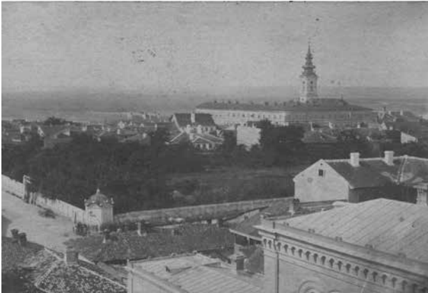
Слика 1 Имање Српског ученог друштва са делијском чесмом око 1865. године

Палата Српске академије наука и уметности 1 је најмонументалнији објекат шире пешачке зоне Кнез Михаилове улице, и незаобилазан чинилац у изградњи њеног визуелног идентитета. Њена централна позиција на средишњем проширењу улице, маркира место спајања пијацете Филозофског Факултета, улица Ђуре Јакшића и Чика Љубине, са главном београдском улицом. Подигнута је у периоду од 1914. до 1924. године као Палата Краљевске Академије Наука на имању које је припало овој институцији приликом оснивања 1. новембра 1886, по члану 31 Основног закона Краљевско – српске академије који је установила Народна скупштина Краљевине Србије. 2 Академија је наследивши имовину Српског ученог друштва и њему претходећег Друштва Српске Словесности, наследила и дар Кнеза Михаила – имање омеђено касније формираним улицама од којих је једна понела његово име. (Слика 1)